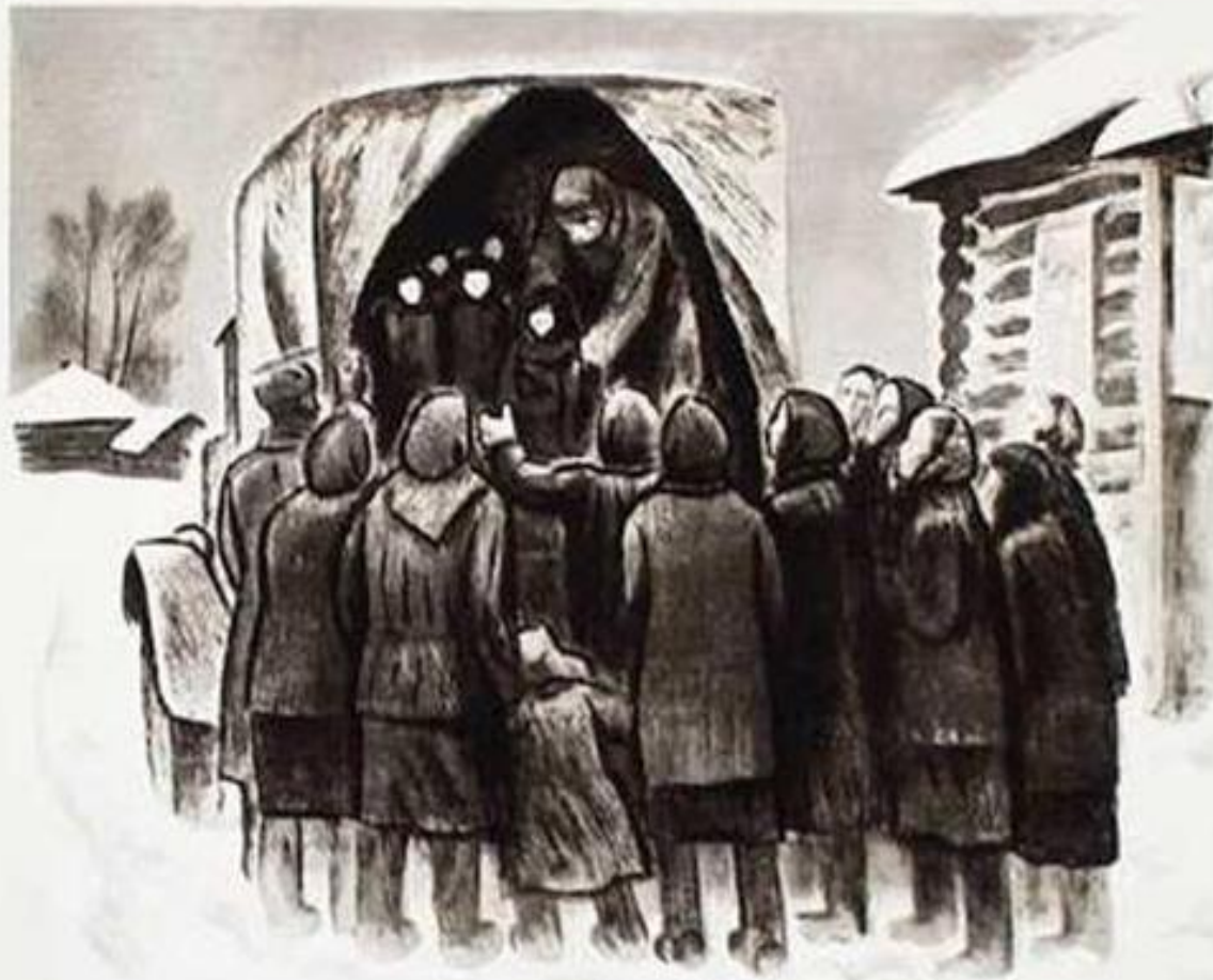
Эвакуация детей и стариков.