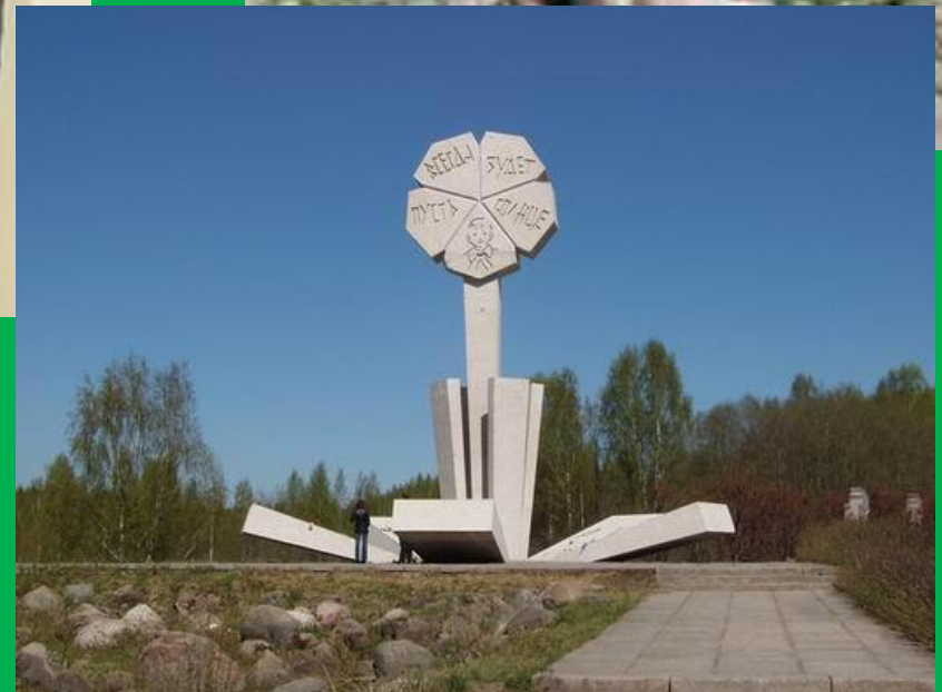
Детям блокады. Памятники в Санкт-Петербурге